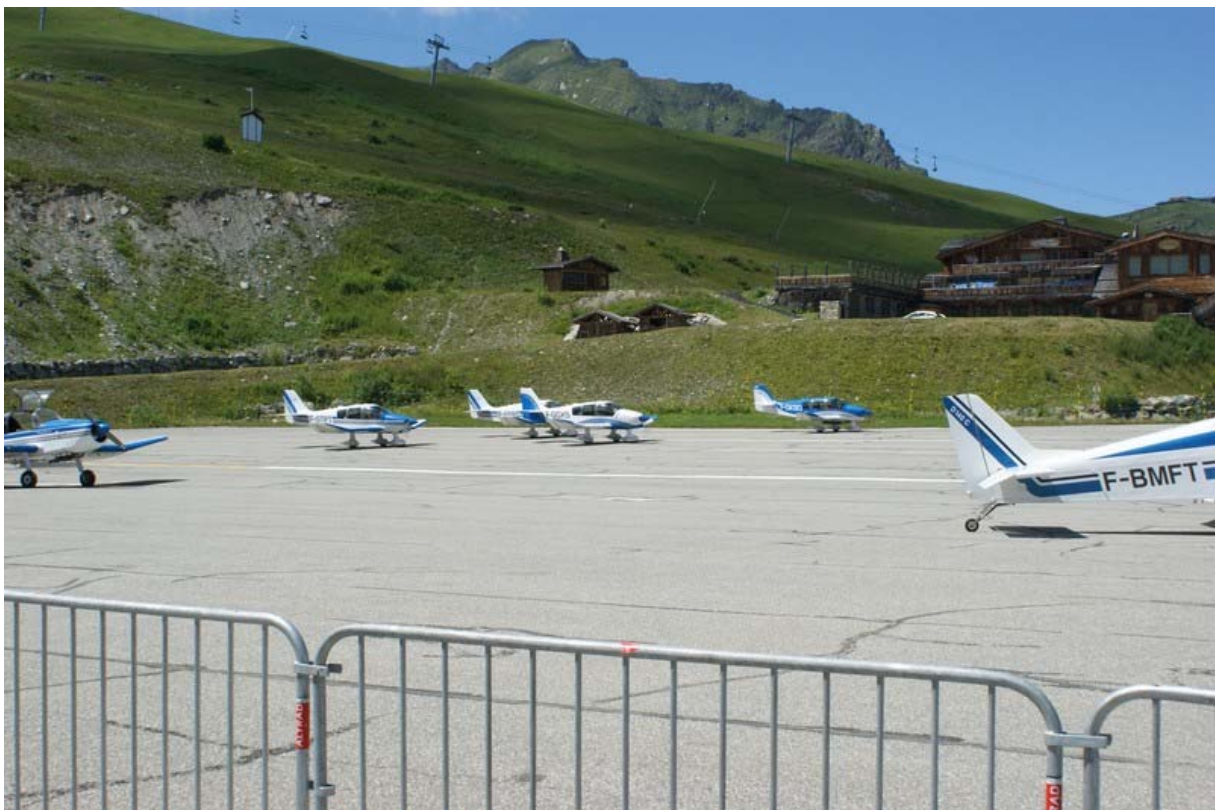
et la patrouille des WIPS (4 DR 400 de l'Aéroclub du Dauphiné)