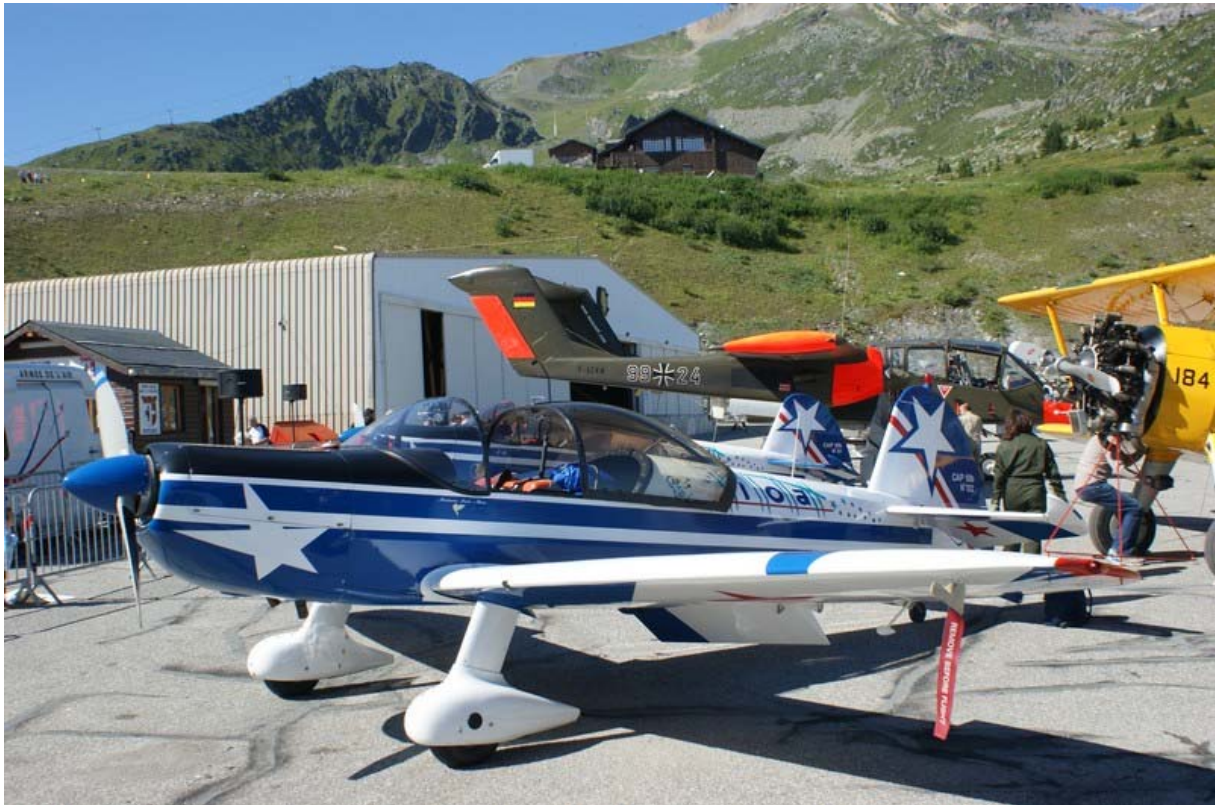
le Bronco de Montélimar, la patrouille Cap'Tens , la patrouille REVA complétaient le plateau