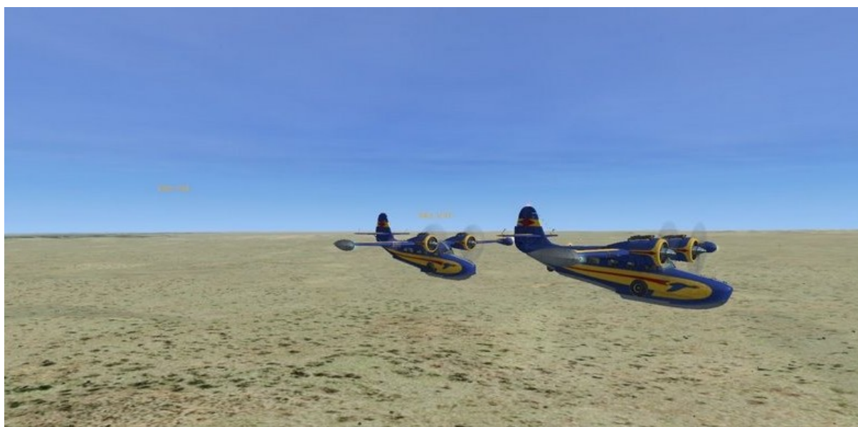
En route vers TRIPOLI

Le Tour Historique de la Méditerranée s'est également poursuivi tous les vendredis soir pendant le mois d'Aout. La troupe des Gooses a donc poursuivi son périple à partir d'Alexandrie en direction de la Lybie puis de la Tunisie jusqu'à DJERBA.