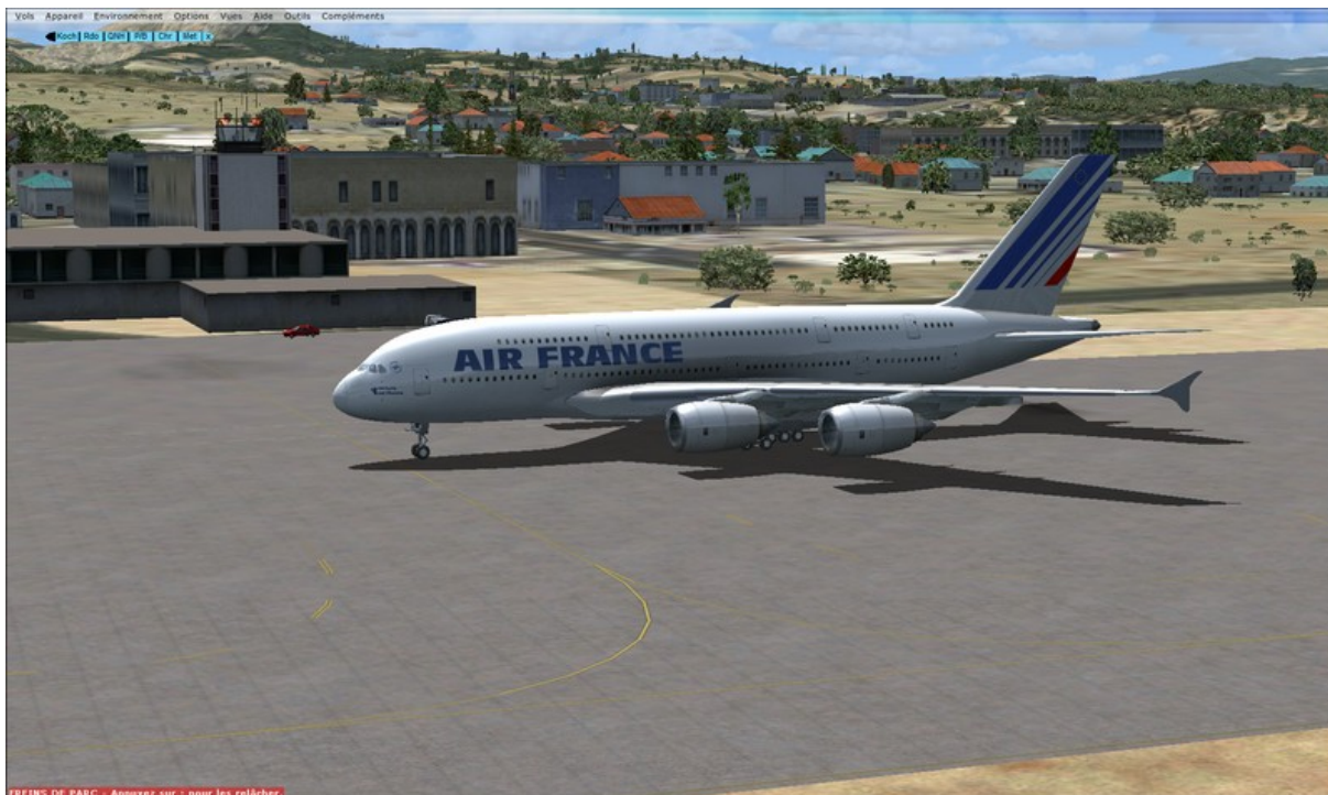
Un gros (très gros) porteur au départ de LGIR en route vers Athènes.

Enfin le 27 Aout retour à des altitudes plus raisonnables avec un vol autour de la CRETE à partir de LGIR.