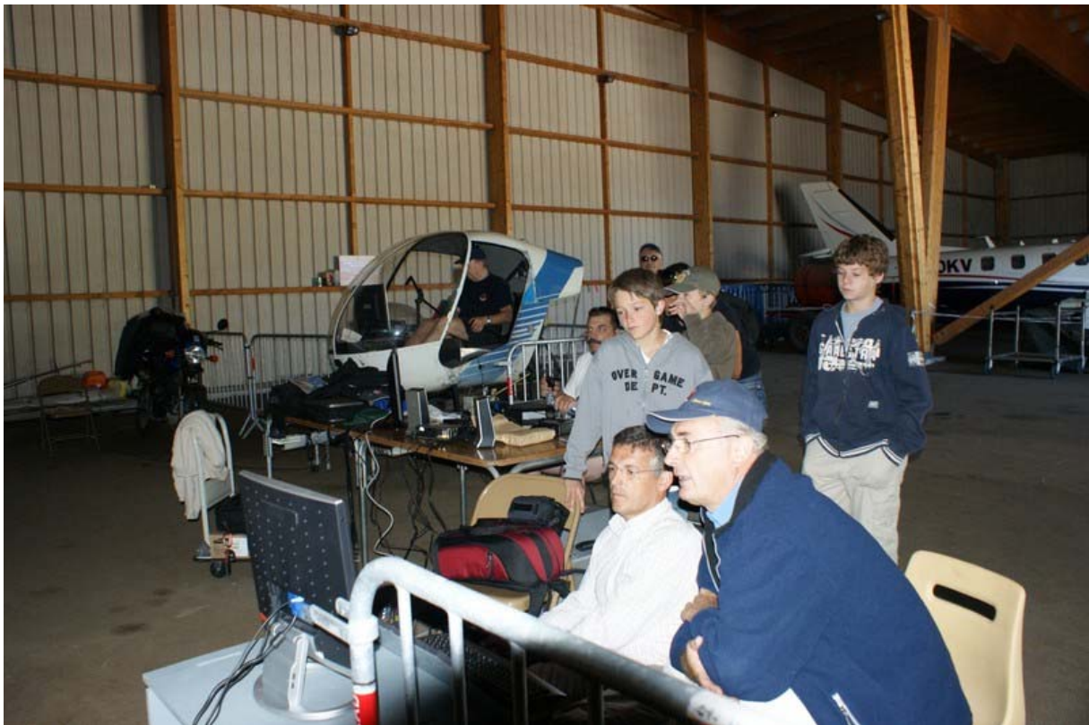
RAS présentait aussi le R22 du CELAG.

RAS bien sur était présent avec deux cockpits de simulation ouverts au public sur lesquels était installé le décor local ce qui permettait de voler en réel et en virtuel sur l'altiport.