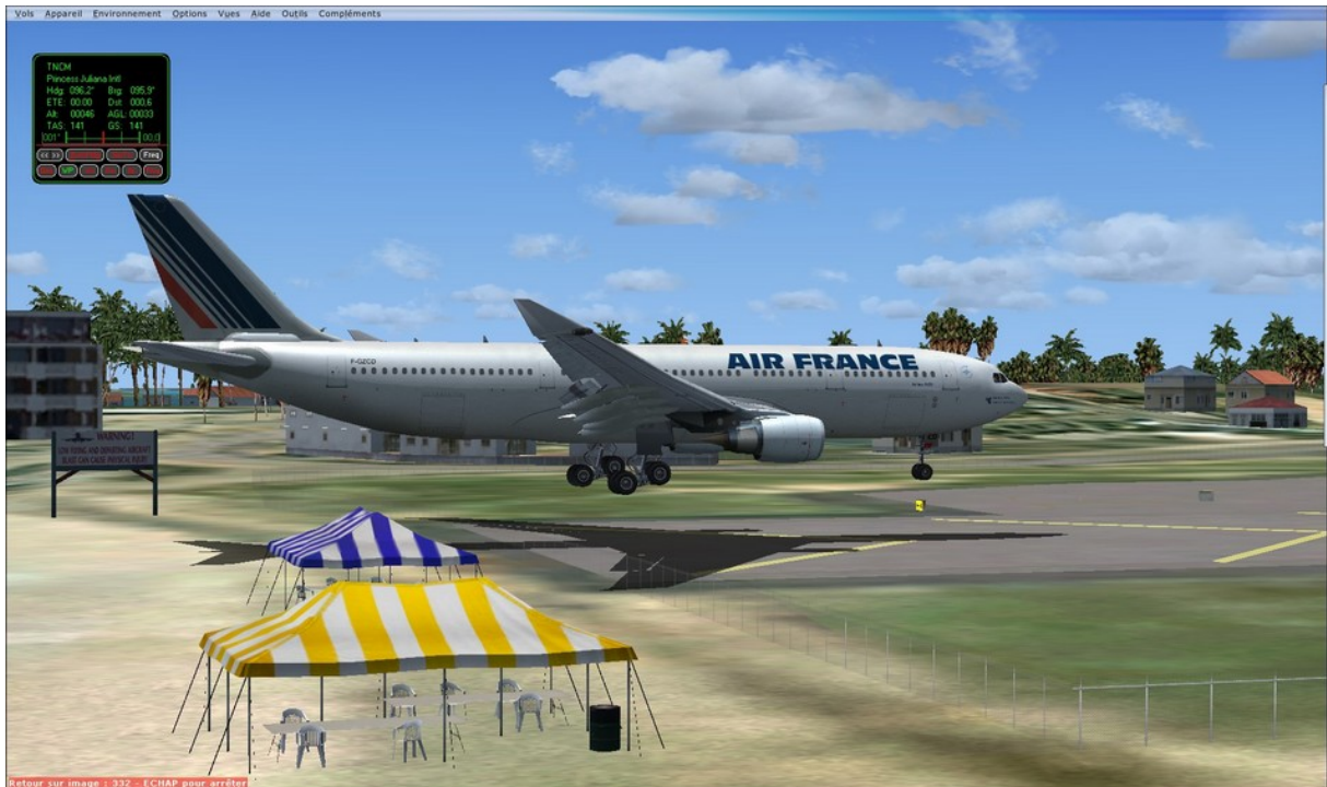
Atterrissage à TNCM –