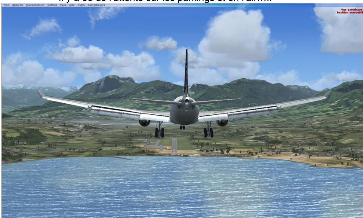
Approche sur LFLB