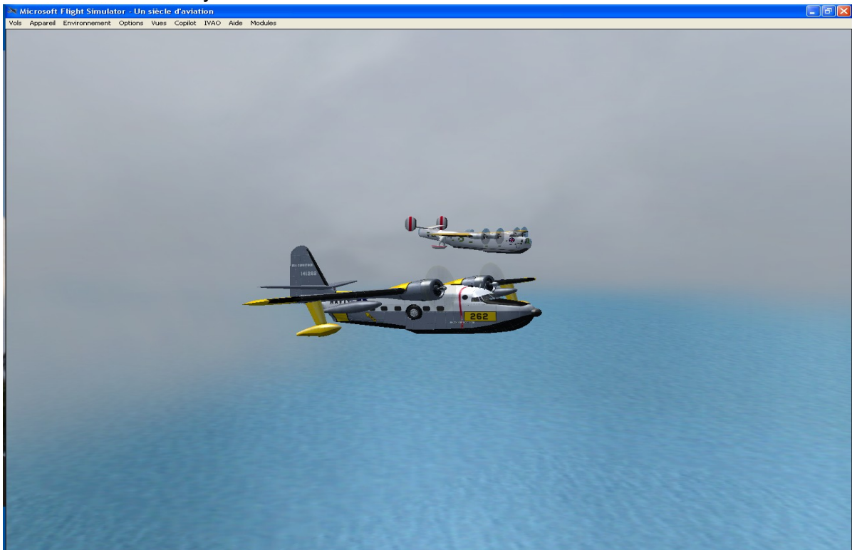
Au large de Beyrouth