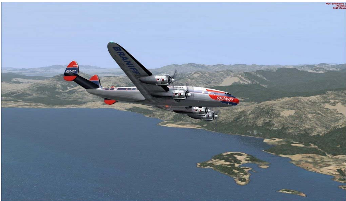
En vol au dessus de Corfou