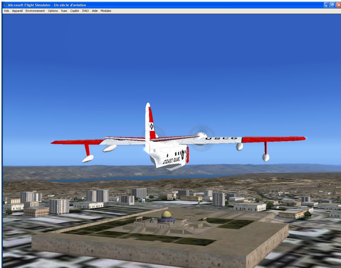
Jerusalem : la grande mosquée et au fond la Mer Morte