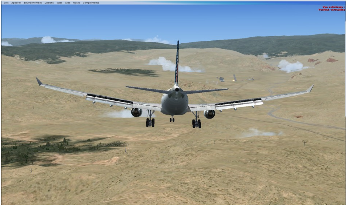
Approche sur KEGE