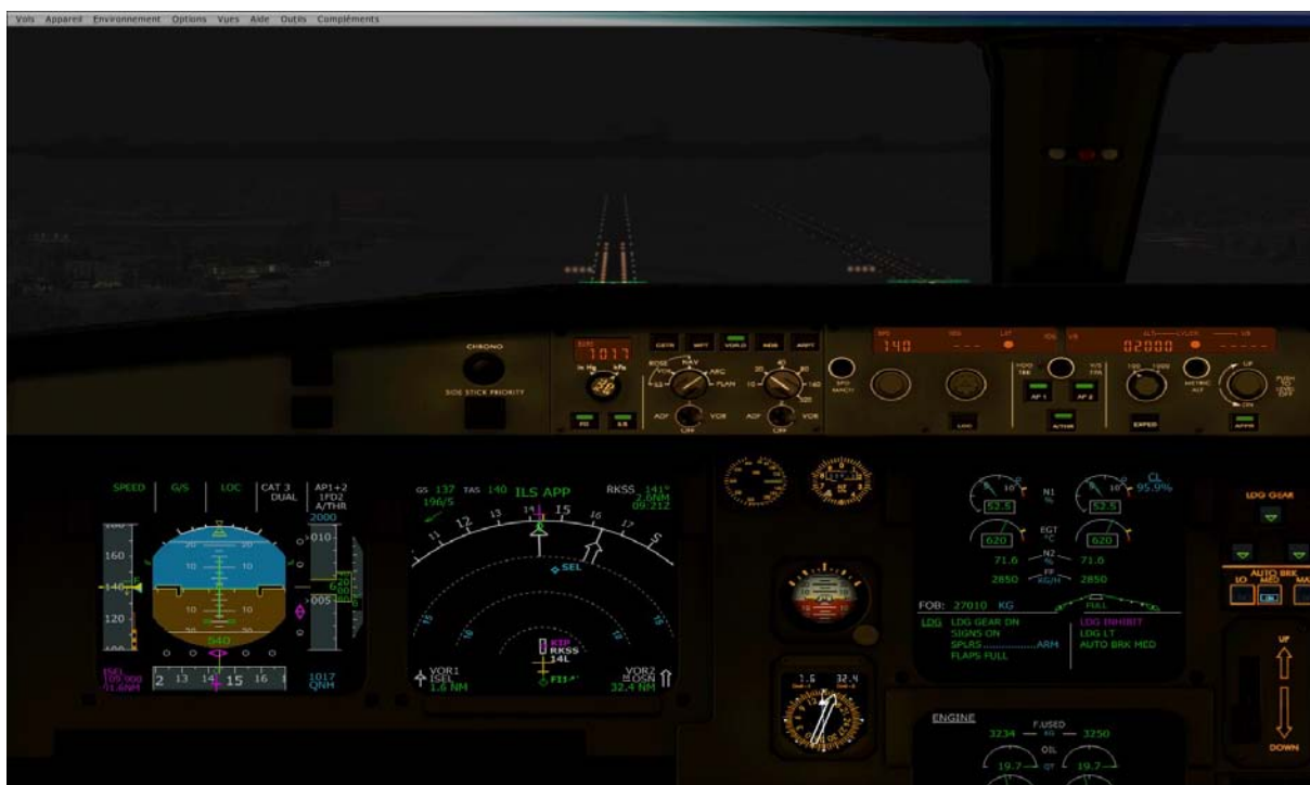
Approche ILS sur SEOUL

Ensuite une visite de deux semaines entre le pays du matin calme et celui du soleil levant avec un vol organisé entre Séoul et Nagasaki.