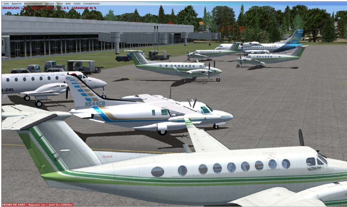
Le parking de Conception est très prisé !!

Une remontée de la côte chilienne en passant par Santiago, La Serena pour atteindre le désert d'Atacama vers Copiapo.