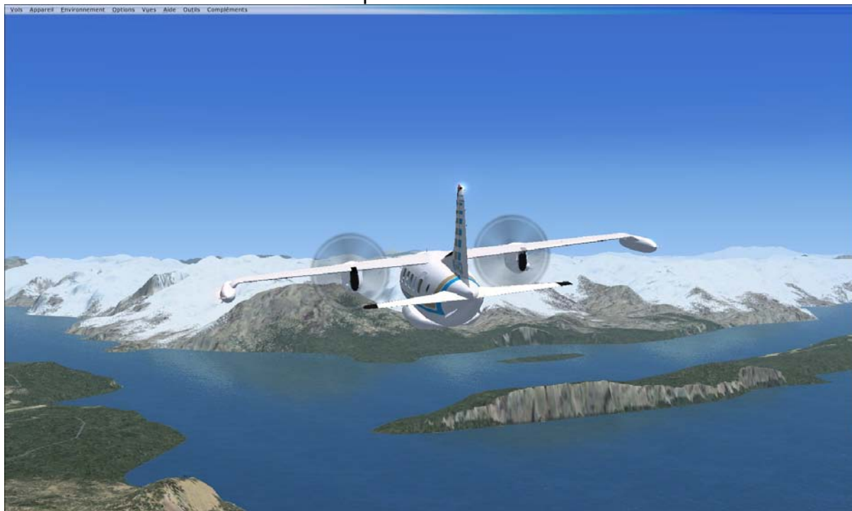
Départ de San Carlo de Bariloche

Partis de Punta Arenas, les pilotes sont remontés dans un premier temps au dessus de la pampa Argentine en bordure de l'océan Atlantique pour faire escale à Santa Cruz puis Rivadavia. Ensuite la troupe a obliqué vers le Chili avec une magnifique escale à San Carlo de Bariloche au pied des Andes.