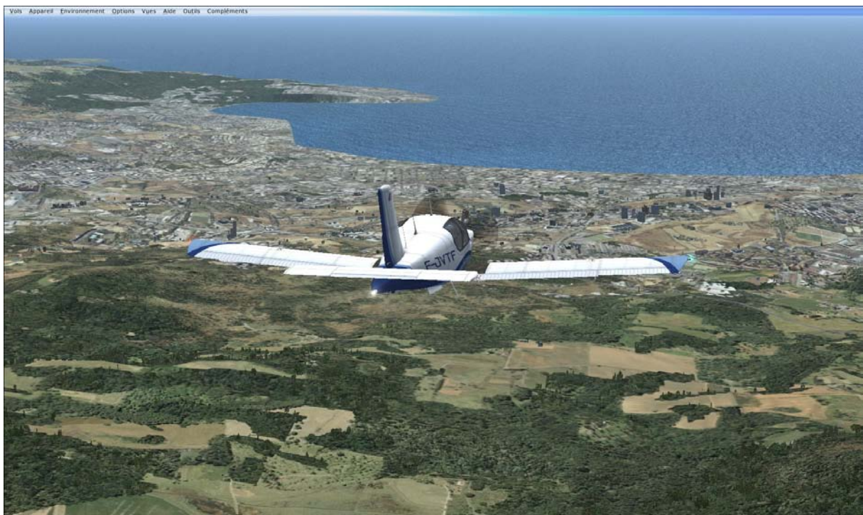
Survol de Valparaiso

Une remontée de la côte chilienne en passant par Santiago, La Serena pour atteindre le désert d'Atacama vers Copiapo.